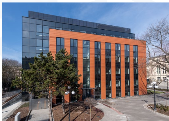
AGH Wydział Wiertnictwa