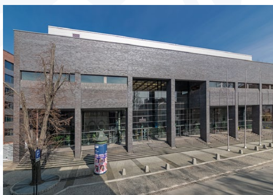
UJ Audytorium Maximum