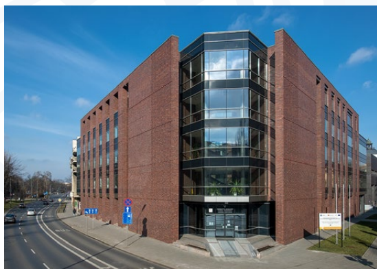
UJ Collegium Paderevianum II

W tegorocznym zestawieniu znalazło się 8 polskich uczelni. Wśród krakowskich najlepiej wypadł Uniwersytet Jagielloński , który utrzymał swoje miejsce w piątej setce najlepszych uczelni na świecie. Na Liście ponownie znalazła się także Akademia Górniczo-Hutnicza w Krakowie , która zajęła miejsce w przedziale 901-1000.