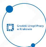
Grodzkiego Urzędu Pracy

Już od 2 października zaczną działać nowe stanowiska informacyjno-obstugowe: