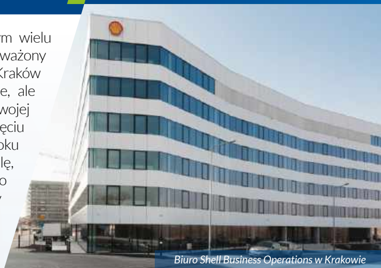
Biuro Shell Business Operations w Krakowie

Zatrudniają ponad 4 tysiące pracowników w tym wielu mieszkańców Krakowa, od lat angażując się w zrównoważony rozwój miasta - Shell Business Operations Kraków to nie tylko wiodący pracodawca w Małopolsce, ale także miejsce, gdzie ludzie myślą o przyszłości swojej i swojego otoczenia. SBO Kraków to jedno z pięciu centrów operacyjnych Shell na świecie. Od 2006 roku sukcesywnie zwiększa swoją międzynarodową rolę, przyczyniając się do rozwoju Krakowa jako wiodącego europejskiego ośrodka biznesowego. Pracownicy SBO aktywnie wspierają miasto w staraniach o poprawę jakości powietrza i ochronę środowiska, promując postawy wspierające zrównoważony rozwój.