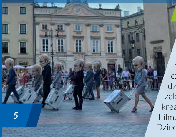
Teatr KTO, Peregrinus, Rynek Główny, 11.08.2020

Krakowska „Kultura Odporna” na pandemię to współpraca, solidarność, wzajemne wzmocnianie się oraz dialog w sferze kultury.