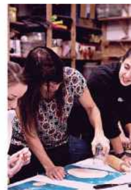
Statuetki w konkursie „Krakowski Ambasador Wielokulturowości”