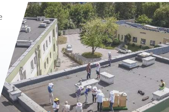
Pszczoły na dachu Edycja IV – 2017 Koszt: 22 122 zł

Obecnie budżet obywatelski to narzędzie wspierające budowanie lokalnego kapitału społecznego i poszukiwania innowacji społecznych. Ułatwia to m.in. dążenie miejskich władz do tworzenia wspólnych miejsc spotkań społeczności dzielnicowych, które mają realny wpływ na jakość projektów i łączą osoby zaangażowane w realizację wspólnych celów. Identyfikacja bieżących potrzeb mieszkańców w ramach promowanej obecnie edycji budżetu obywatelskiego, czyli etap składania propozycji zadań, został w tym roku zaplanowany między 1 a 30 kwietnia. W tym czasie, na specjalnie dedykowanej platformie znajdującej się pod adresem: budzet.krakow.pl będzie można zgłaszać projekty, które zostaną wybrane w tym, a zrealizowane w przyszłym roku.