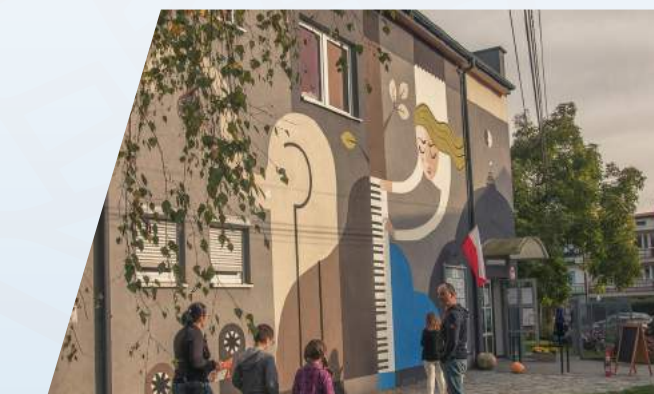
Zielone Centrum Przegorzał Edycja IV – 2017 Koszt: 100 000 zł