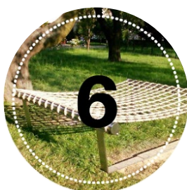
Hamak 2500 zł