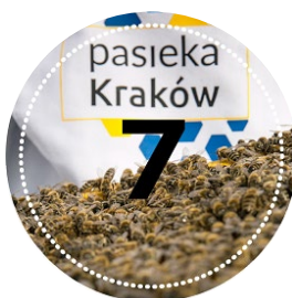
Pasieka 10 000 zł – 5 uli