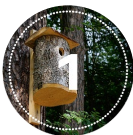
Budki lęgowe dla zwierząt 150 zł