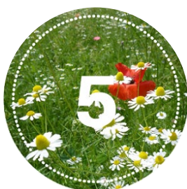
Łąka kwietna 1500 zł / 100 m 2