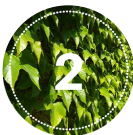
Zielony ekran 200 zł