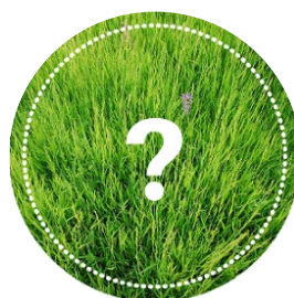
Oferta „Szyta na miarę”

Zarząd Zieleni Miejskiej w Krakowie jako pierwszy w Polsce wprowadził do swoich działań pakiety sponsorskie. Początki współpracy z firmami oraz instytucjami mają swoje źródło w strategii CSR (społeczna odpowiedzialność biznesu), którą coraz chętniej i na szerszą skalę realizują duże firmy. Pakiety dają możliwość aktywnego włączenia się w dbanie o zieloną przestrzeń miasta. Ich powstanie zostało zainicjowane przez firmę, która zgłosiła się z chęcią przeznaczenia środków na zazielenienie Krakowa.