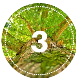
Drzewo 700-1000 zł