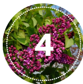
50 krzewów 1000 zł